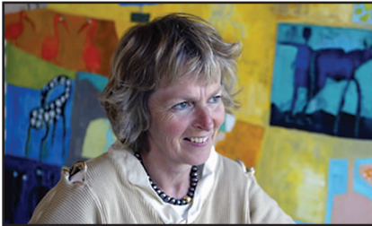
af Birgitte Skallgård www.birgitteskallgaard.dk

Da jeg var barn var der særligt to af bibelens billedskabende fortællinger, der gjorde indtryk på mig. Den ene var fortællingen om Noahs ark - hvor jeg gruede ved tanken om, hvordan det ville være at skulle forlade mange af sine nærmeste og give sig en rejse mod ukendt mål - i håbet om at redde livet. Jeg undrede mig over alle de praktiske vanskeligheder Noah måtte have stået overfor ved udførelsen af Guds ordre f.eks. om et dyr af hvert køn - hvad nu med myggene? Hvordan ville han kende dem fra hinanden og så midt i rejseforvirringen?