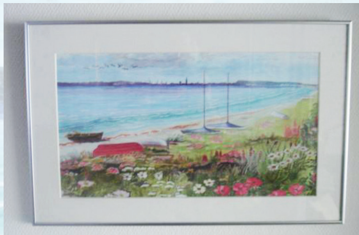
Der trækkes lod om dette billede til generalforsamlingen.