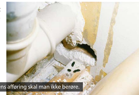
Rottens afføring skal man ikke berøre.