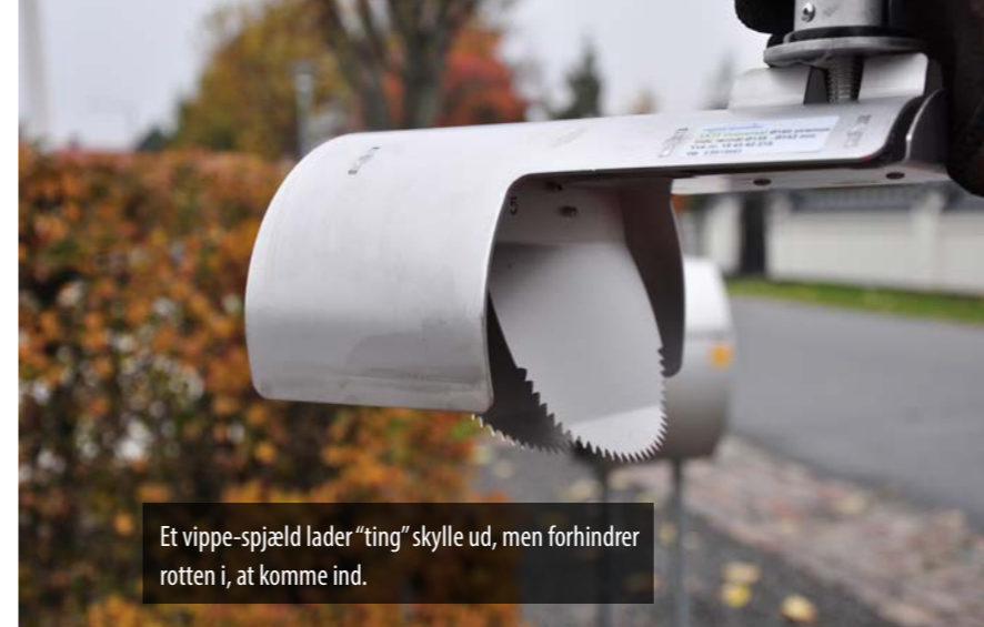
Et vippe-spjæld lader "ting" skylle ud, men forhindrer rotten i, at komme ind.

Vi har ret stor erfaring med at montere rotteklapper - vi har monteret flere tusinde, og har da også vundet entreprisen på at vedligeholde rotteklapperne i Aarhus Kommune.