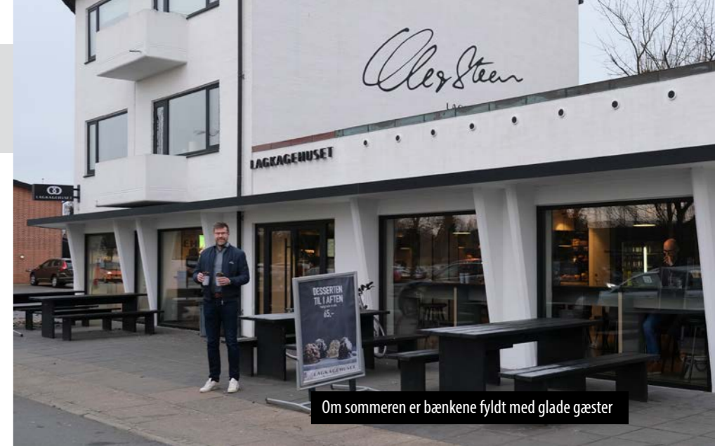
Om sommeren er bænken fyldt med glade gæster

-Risskov er bare det bedste sted at være - kunderne er så søde og vi har meget at