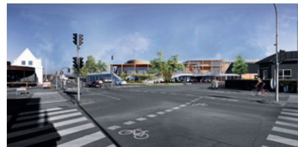
C.F.Møller Architects – "illustrationen er vejledende"

GVF er for en afstemt og tilpasset udvikling af Vejlbj Fed. Men developere må også tage med i deres overvejelser, hvor meget man kan presse ind i et smukt gammelt kvarter.