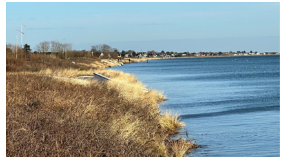
Kysten ved Risskov i forbindelse med stormen Pia den 22.december kl.11, da vandet stod på sit højeste, 150 cm over normal vandstand.