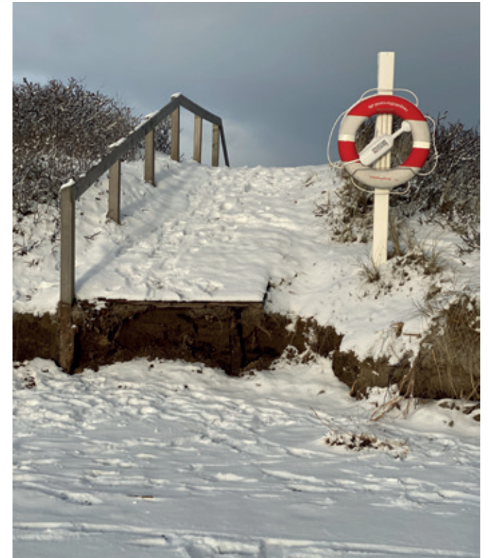
Dige overgang ved Themsvej/ Bellevuebanerne

En ting er dog sikkert og det er, at debatten forsætter, men også at Risskov som bydel i forhold til Aarhus Kommune står stærkest hvis vi som beboere finder enighed om, hvordan vi ønsker at sikre vores kyststrækning fremadrettet.