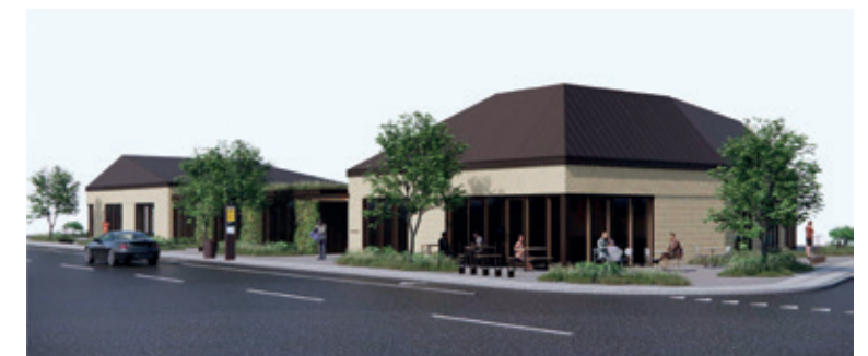
Fortevej 80/ Ndr. Strandvej 15. illustration: Krabbe og Vang