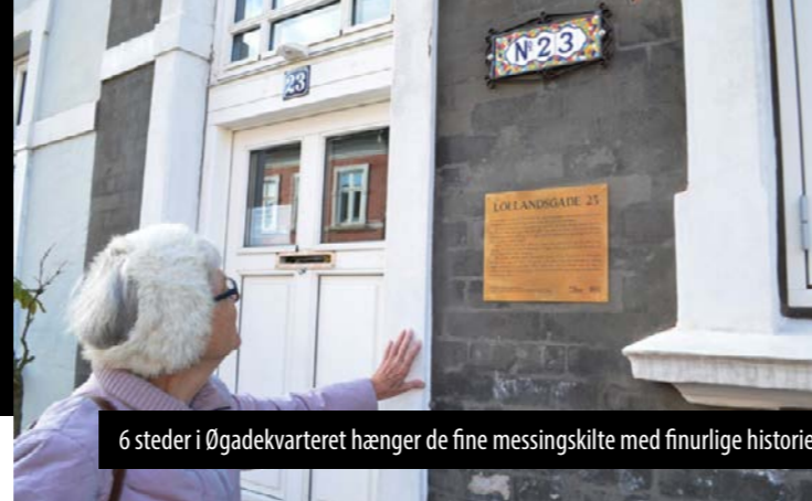
6 steder i Øgadekvarteret hænger de fine messingskilte med finurlige historier