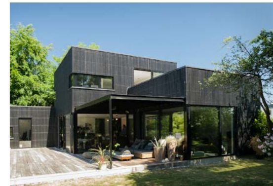
Et forslag til prisen for "Flotteste nybygning" på Solmarksvej 24. De øvrige forslag kan ses på hjemmesiden gvf-risskov.dk