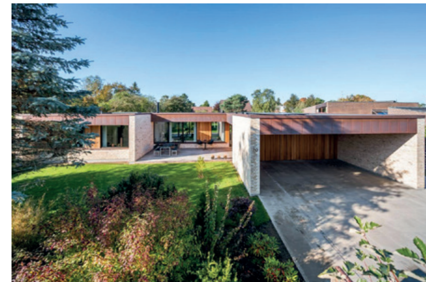
Vinderen af flotteste nybygning i 2021 – Ryvangs Allé 20

De indstillede emner vil blive vist på GVF's hjemmeside: gvf-risskov.dk og vinderen får et diplom.