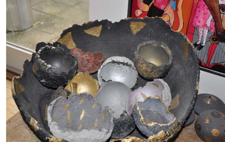
Pynte-skåle støbt i beton og malet