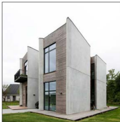
Åkrog Strandvej 47f vandt prisen "Flotteste nybygning 2017"