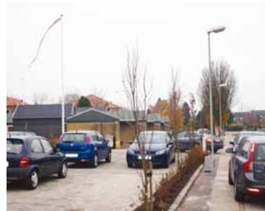
En lukket vej betyder, at biler til plejecenter og børnehave kører ad Hørmarks Alle. Det klager beboerne over.

Grundejerforeningen bakker op om beboernes klage. Hørmarks Alle er en smal villavej, der efter vores overbevisning ikke er egnet som adgangsvej til to institutioner som børnehave og plejecenter.