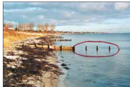
Vor dejlige strand - hofderne vil Århus Kommune desværre ikke reparere!